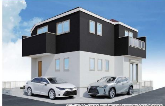
※同一会社が一切図面を現況と異なる場合は現況を優先させていただきます。

1号棟 4LDK 車通りがほとんどない、静かで安心な住環境です。角地のため駐車もラクラク♪