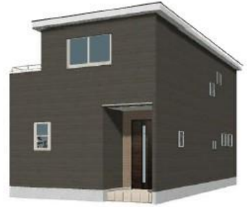
※間取り図は、このイメージを基に描いたもので実際とは多少異なる場合がございます。

(物件概要)所在地/〔地番〕埼玉県春日部市大会字内谷津378-75(住居表示)埼玉県春日部市大会378-75(土地権利)所有権(口地目)/宅地(口 総棟数/1棟(口販売棟数/1棟(口建物構造/木造在来軸組工法2階建(910モジュール)口都市計画/市街化区域(口用途地域/第一種中高層住居 専用地域(口建ぺい率/60%(口容積率/200%(口設備/東電電力・集中L.P.G・公営水道・本下水口接道状況/東側6.2m公道・南側6.2m公道(口現 況/造成中(口完成/2025年1月下旬予定(口引渡日/2025年1月下旬予定(口備考/※広告の取扱いに関しては法令遵守にてお断りします。※開 戸・照明・浴槽・カーテンレール・防犯パン・カーポートはオプションとなります。※宅地内に電柱及び支線が入る場合があります。※司法書士 は、当社指定になります。※図面と現況に相違がある場合は現況優先とします。※全棟が長期優良住宅対象物件です。広告有効期限/2024年9 月30日