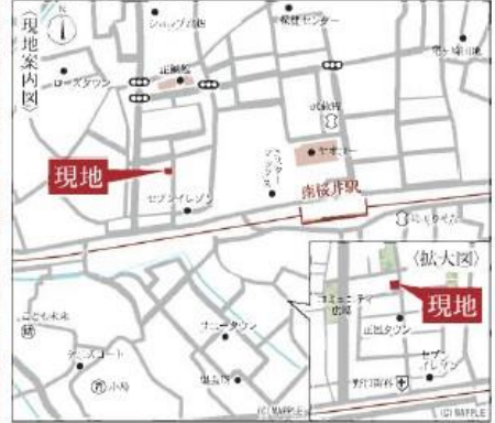
Car navigation 春日部市大会378-75