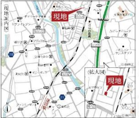
Car navigation 蓮田市椿山4-21-4