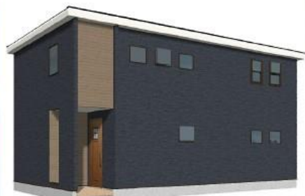
※完成予想図/このパースは図面を基に描いたもので実際とは多少異なる場合がございます。