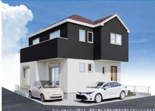
※パースはイメージ図です。現況と異なる場合は現況を優先させていただきます。