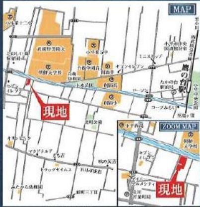
カーナビ入力 小平市上水新町2-1-9付近と入力して下さい

西武国分寺線 「鷹の台」駅徒歩20分 西武拝島線 「東大和市」駅徒歩24分 西武拝島線・多摩モノレール 「玉川上水」駅徒歩34分 JR中央線 「国立」駅徒歩40分「立川」駅バス23分 「若葉町団地」駅徒歩4分