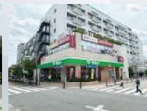
サミットストア芦花公園駅前店