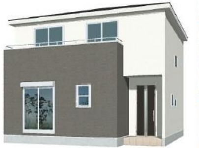
※完成予想図/このハウスは図面を基に描いたもので実際とは多少異なる場合がございます。

物件番号 888A-AD0D | 情報公開日 2024年11月06日 | 広告有効期限 2024年11月21日 | 仲介手数料無料+期間限定キャンペーン実施中!