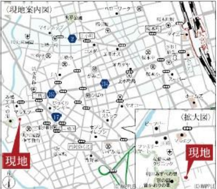
Car navigation さいたま市大宮区三橋4丁目71-4

〔物件概要〕所在地/〔地番〕埼玉県さいたま市大宮区三橋4-71-4、(住居表示)埼玉県さいたま市大宮区三橋4丁目71番4口土地権利/所有権口地目/宅地口総棟数/1棟口販売棟数/1棟口建物構造/木造在来軸組工法2階建(910モジュール)口都市計画/市街化区域口用途地域/第2種中高層住居専用地域口建ぺい率/60%口容積率/200%口設備/東京電力・都市ガス・公営水道・下水道口接続状況/南西側4m私道口現況/古屋あり口完成/2024年12月下旬予定口引渡日/2025年1月下旬予定口備考/※広告の取扱いに関しては法令遵守にてお願いします。※網戸・照明・溝蓋・カーテンレール・防水パン・カーポートはオプションとなります。※宅地内に電柱及び支線が入る場合があります。※司法書士は、当社指定になります。※図面と現況に相違がある場合は現況優先とします。※全棟が長期優良住宅対象物件です。広告有効期限/2024年9月30日