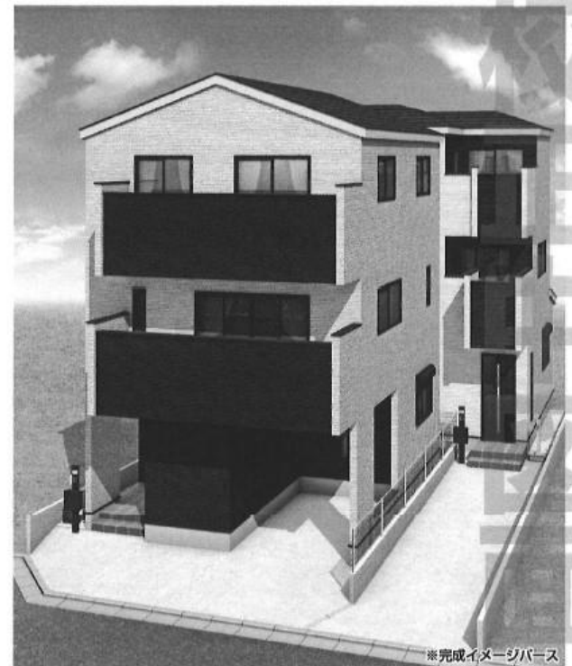
※完成イメージパース