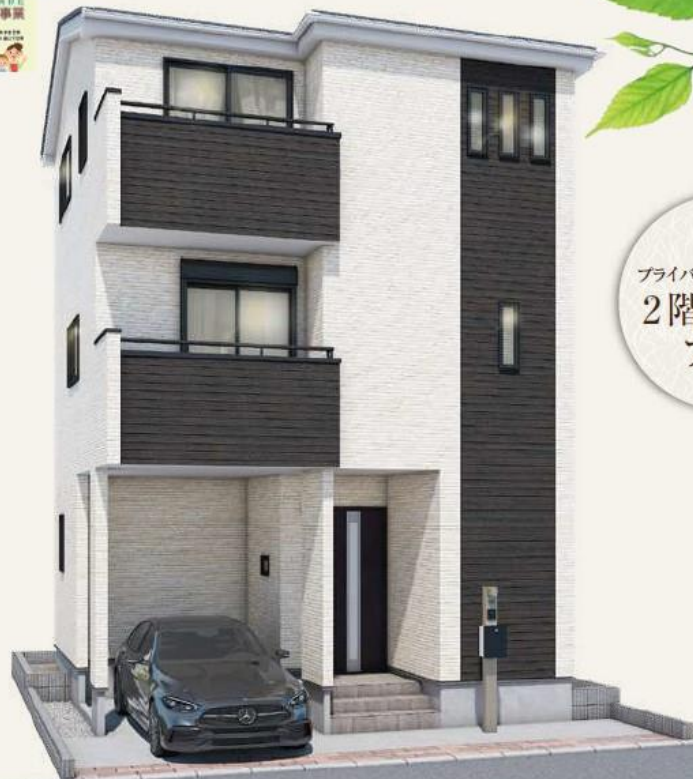
完成予想パース（実際とは多少異なることがあります）