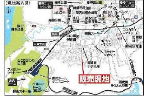
Car navigation 埼玉県所沢市山口2032-5

【物件概要】所在地 / (地番)埼玉県所沢市大字山口字新街2032-5 (住居表示)埼玉県所沢市山口2032-5 □土地権利 / 所有権 □地目 / 宅地 □築年数 / 1棟 □販売形態 / (概)建物構造 / 木造在来軸組工法2階建 (900モジュール) □都市計画 / 市街化区域 □用途地域 / 第一種低層住居専用地域 □建ぺい率 / 50% □容積率 / 80% □敷地 / 東武電力 都市ガス 私有水道 本下水 □擁壁状況 / 東側4m私道 □完成 / 2024年10月上旬予定 □引渡日 / 2024年10月中旬予定 □備考 / ※広告の版数に 関しては法令遵守をお願いいたします。※銀行・明細・履歴・カーテンレール・防虫・センサー・カーポートはオプションとなります。※完成後に電柱及び電線が入る場合があります。※司法書士は、当社指定になります。※国面と現況に相違がある場合は現況優先とします。尚全棟が長期優良住宅創作物件です。広告有効期限 / 年月日