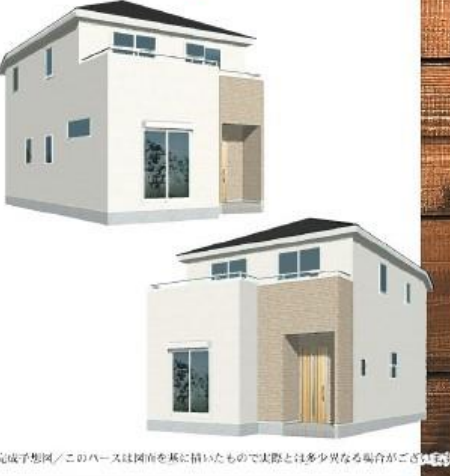
※完成予想図/このパースは南向きを基に描いたもので実際とは多少異なる場合がございます。

物件番号 5162-5E2A 情報公開日 2024年11月17日 広告有効期限 2024年12月02日 仲介手数料無料+期間限定キャンペーン実施中!