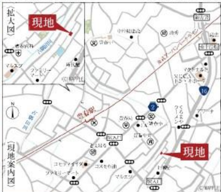
Car navigation 春日部市増富672-30