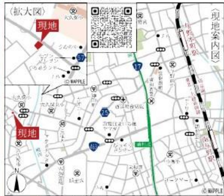
Car navigation さいたま市桜区五関851付近

【物件概要】所在地(地番)埼玉県さいたま市桜区大字五関字水入851番1(住居表示)埼玉県さいたま市桜区五関851-1土地権利/所有権/地目/宅地/総棟数/8棟/販売棟数/5棟/建物構造/木造/在来組工法2階建(910モジュール)/都市計画/市街化調整区域/用途地域/無指定/建ぺい率/80%/容積率/200%/設備/東京電力/個別LP-G/公営水道/本下水口接続状況/北東側7.73m公道/南東側4m公道/北西側6m私道/開口状況/更地/完成/2024年5月下旬引渡日/2024年6月中旬引渡日/計画決定/備者/※広告の取扱いに関しては法令遵守にてお願いいたします。※経戸・照明・濡濡・カーテンレール・防水パン・カーポートはオプションとなります。※宅地内に電柱及び電線が入る場合があります。※司法書士は、当社指定になります。※図面と現況に相違がある場合は現況優先とします。広告有効期限/2024年3月31日