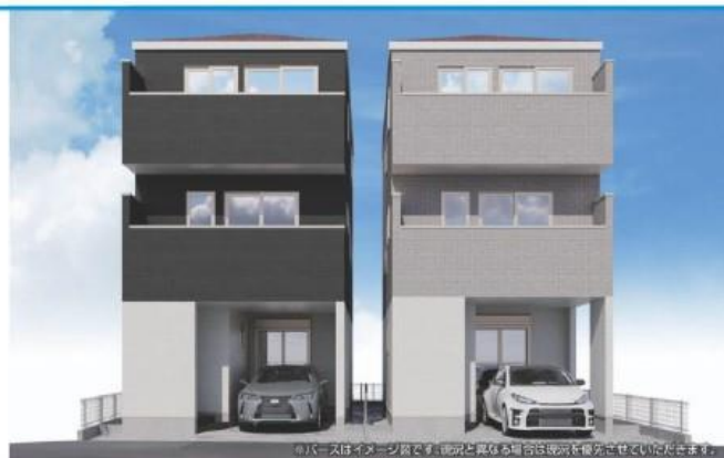
※カーナビイメージ図です。現況と異なる場合は現況を優先させていただきます。