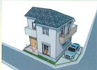
※イメージパース 実際のものとは異なる場合があります