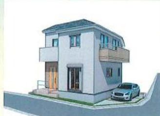
※イメージパース 実際のものとは異なる場合があります