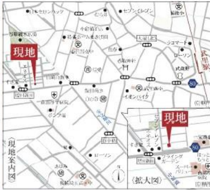
Car navigation 春日部市増田新田391-14

Life information 武里西小学校.....1,500m(徒歩19分) 春日部南中学校.....683m(徒歩9分) スーパーバリュー春日部大場店...250m(徒歩4分) セブンイレブン春日部大場西店...510m(徒歩7分) ドラッグセイムス春日部大場店...1,379m(徒歩18分) 医療法人光仁会南部厚生病院...417m(徒歩6分)