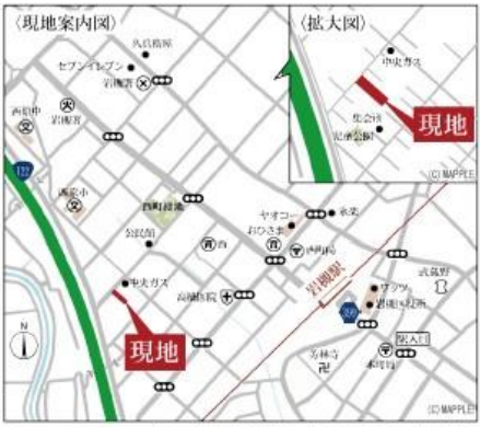
Car navigation さいたま市岩槻区西原台2-3-101付近

[物件概要] 所在地/(地番)埼玉県さいたま市岩槻区西原台2-4009.(住居表示)埼玉県さいたま市岩槻区西原台2以下未定口土地権利/所有権口地目/畑口総棟数/2棟口販売棟数/2棟口建物構造/木造在来軸組工法2階建(910モジュール)口都市計画/市街化区域口用途地域/第一種低層住居専用地域口建ぺい率/50%口容積率/80%口設備/東京電力・都市ガス・公営水道・下水口接続状況/北西側4.0m~5.0m公道(認定2.73m)口現況/造成中口完成/2025年1月中旬予定口引渡日/2025年1月下旬予定口備考/協定道路は地役権を設定いたします。※広告の取扱いに関しては法令遵守にてお願いいたします。※網戸・照明・蒸気・カーテンレール・防水パン・カーポートはオプションとなります。※宅地内に電柱及び支線が入る場合があります。※司法書士は、当社指定になります。※図面と現況に相違がある場合は現況優先とします。※全棟が長期優良住宅対象物件です。広告有効期限/2024年9月30日