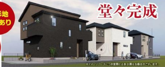
※イメージバスに隣接する場合は多少異なる場合がございます。