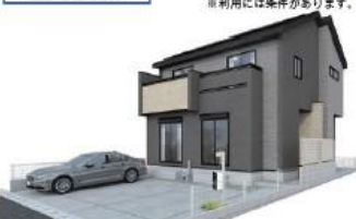
3Dイメージはイメージです。実際は写真に基きおこなったもので実際とは多少異なります。

ゆりのき通り近くの利便性良好な環境。敷地面積39坪・南道路・カースペース並列3台可! 住宅性能評価W取得・長期優良住宅かつBELS・ZEH水準のたしかな品質。耐震等級3(最高級)・断熱等性能等級5の永住邸!