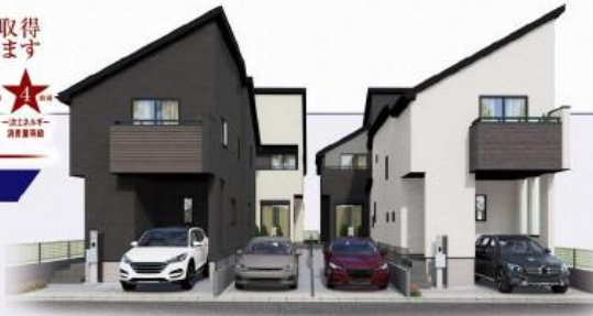
※イメージパースにつき実際とは多少異なる場合がございます。