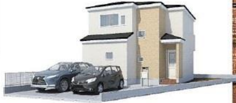
※完成予想図/このイメージは計画を基に描いたもので実際とは多少異なる場合がございます。