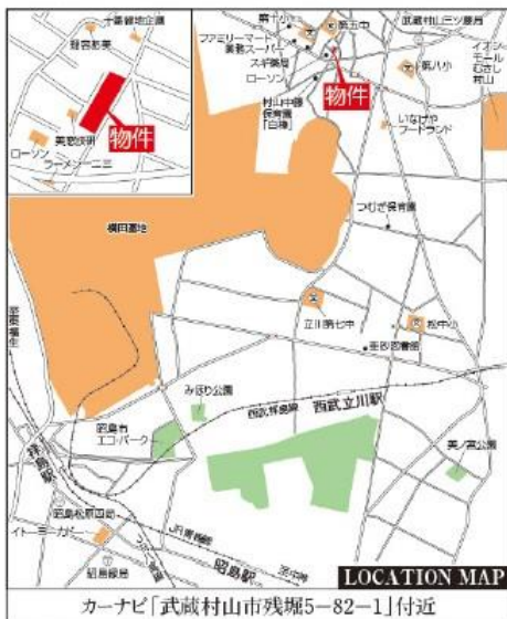
カーナビ「武蔵村山市残堀5-82-1」付近