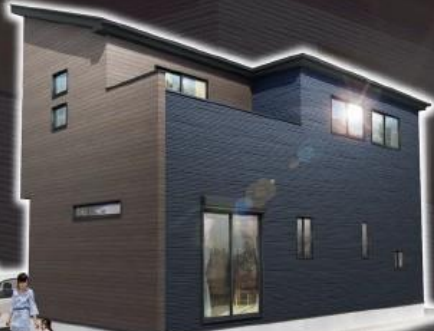
※イメージです。実際とは多少異なる場合がございます。

コーススペース2台可! セブンイレブン徒歩4分、ユニクス10分と買物便利な住環境