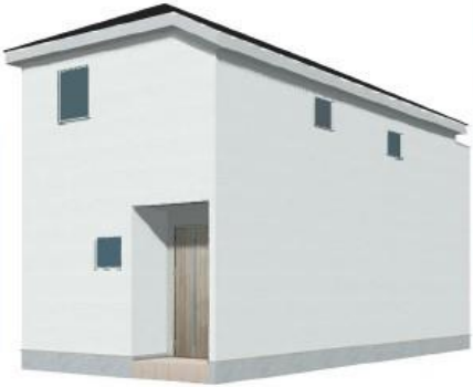
※完成予想図/このハウスは実物を基にしたもので実際とは多少異なる場合がございます。

[物件概要] □所在地/〔地番〕埼玉県さいたま市緑区宮本2-3-15、(住居表示)埼玉県さいたま市緑区宮本2丁目3-15 □土地権利/所有権 □地目/宅地 □総棟数/1棟 □販売棟数/1棟 □建物構造/木造在来軸組工法2階建(910モジュール) □都市計画/市街化区域 □用途地域/第1種低層住居専用地域 □建ぺい率/60% □容積率/100% □設備/東京電力・都市ガス・公営水道・本下水口接続状況/北東側11.9m公道 □現状/造成中 □完成/2025年2月上旬予定 □引渡し/2025年2月上旬予定 □備考/※広告の取扱いに関しては法令遵守にてお願ひします。 ※納戸・照明・濡縁・カーテンレール・防水パン・カーポートはオプションとなります。 ※宅地内に電柱及び支線が入る場合があります。 ※司法書士は、当社指定になります。 ※図面と現況に相違がある場合は現況優先とします。 ※全棟が長期優良住宅対象物件です。 広告有効期限/2024年11月29日