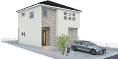
イメージパース※このイラストは図面を基に描きおこしたもので実際の写真とは異なります。

360° パノラマパース スマホでVR内見 BELS 省エネ NURO光 住み始めたらすぐつながる!