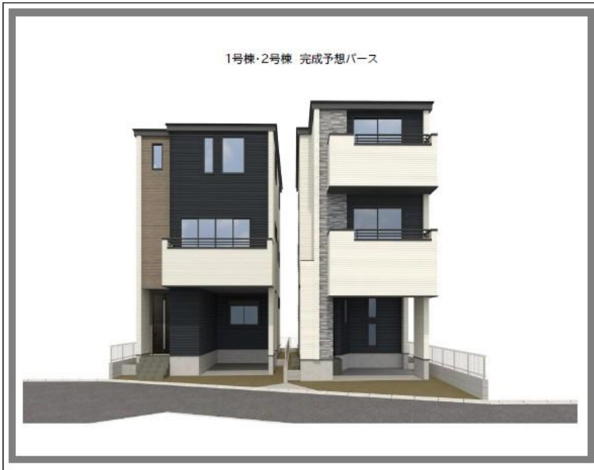
1号棟・2号棟 完成予想パース