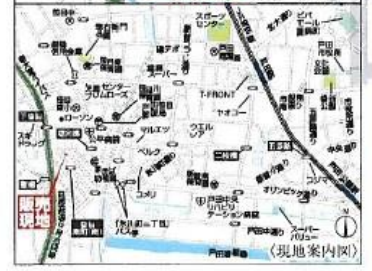
Car navigation 埼玉県戸田市笹目南町24-21