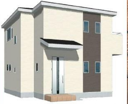
※完成予想図/このハウスは例顔を基に描いたもので実際とは多少異なる場合がございます。

物件番号 AFB0-36D1 | 情報公開日 2024年11月01日 | 広告有効期限 2024年11月16日 | 仲介手数料無料+期間限定キャンペーン実施中!