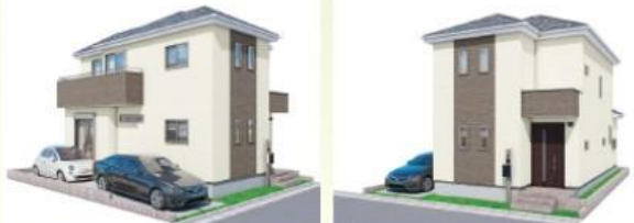
※カラーがベース 実際のものは写真となります ※カラーがベース 実際のものは写真となります