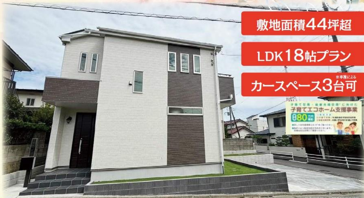
販売現地写真 2024年7月撮影