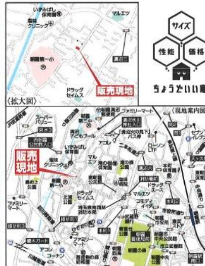
Car navigation 朝霞市溝沼3-6-30

(物件概要) □所在地/埼玉県朝霞市溝沼3-905-15(地番)朝霞市溝沼3-6-30(住居表示) □土地権利/所有権 □地目/宅地 □総棟数/2棟 □販売棟数/2棟 □建物構造/木造在来軸組工法3階建(900モジュール) □都市計画/市街化区域 □用途地域/第一種中高層住居専用地域 □建ぺい率/80% □容積率/200% □設備/東京電力・都市ガス・公営水道・本下水 □築造状況/南東側4m公道 □現況/建築中 □完成/2024年10月下旬予定 □引渡日/2023年11月中旬予定 □備考/※広告の取扱いに関しては法令遵守にてお願いいたします。※網戸・照明・溝線・カーテンレール・防水パン・カーポートはオプションとなります。※宅地内に電柱及び支線が入る場合があります。※司法書士は、当社指定になります。※図面と現況に相違がある場合は現況優先とします。広告有効期限/ 年 月 日