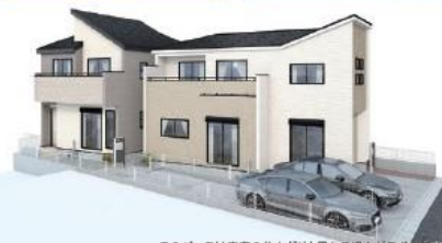
このバスは実際の仕上がりとなる場合がございます。

2号棟 販売価格 3,880 万円 [税込] 3(4)LDK+WIC+カースペース2台 土地面積/123.27㎡ (37.28坪) 建物面積/103.29㎡ (31.24坪) 建築確認番号/第R06SHC107879号