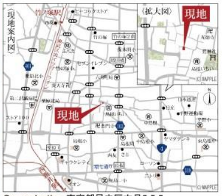
Car navigation 東京都足立区六月2-5-5