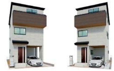
*完成予想図/このパースは図面を基に描いたもので実際とは多少異なる場合がございます。

[物件概要] 所在地/ (地番) 東京都足立区六月2-477-5(住居表示) 東京都足立区六月2-5-5 土地権利/ 所有権 口地目/ 宅地 口総棟数/ 1棟 口販売棟数/ 1棟 口建物構造/ 木造在来軸組工法3階建(900モジュール) 口都市計画/ 市街化区域 口用途地域/ 第1種中高層住居専用地域 口建ぺい率/ 60% 口容積率/ 200% 口設備/ 東京電力・都市ガス・公営水道・本下水口 接道状況/ 北側4m私道 口現況/ 建築中 口完成/ 2024年11月下旬予定 口引渡し日/ 2024年12月上旬予定 口設備/ ※広告の取扱いに関しては法令遵守にてお願いします。 ※網戸・照明・濡緑・カーテンレール・防水パン・カーポートはオプションとなります。 ※宅地内に電柱及び支線が入る場合があります。 ※司法書士は、当社指定になります。 ※図面と現況に相違がある場合は現況優先とします。 広告有効期限/ 2024年9月30日