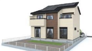
このバスは図面を基に作成されているため、実際の仕上りとは異なる場合がございます。

住宅性能評価W取得と税制優遇の長期優良住宅・BELS評価書取得!! 太陽光パネル・NURO光標準装備 耐震等級3(最高等級)の永住邸♪こだわりの仕様(折上天井・ポップアップ天井・食洗器・玄関カードキー(電池錠))