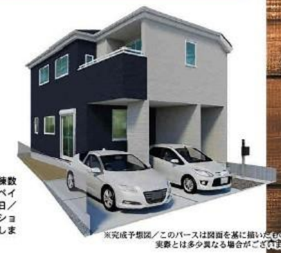
※完成予想図/このパースは図面を基に描いたもので、実際とは多少異なる場合がございます。