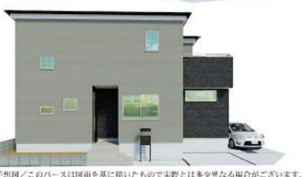
※完成予想図/このパースは図面を基に描いたもので実際とは多少異なる場合がございます。

物件番号 E468-0576 | 情報公開日 2024年10月24日 | 広告有効期限 2024年11月08日 | 仲介手数料無料+期間限定キャンペーン実施中!