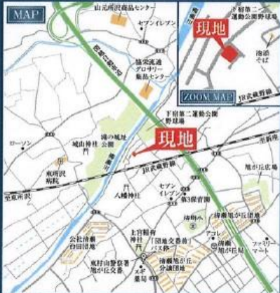
カーナビ入力 清瀬市下宿2丁目103-6付近と入力して下さい