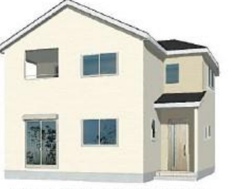
※完成予想図。このハウスは実際の様子に似ているため、実際とは多少異なる場合がございます。

[物件概要] □所在地/(地番)埼玉県三郷市高州3-125-1(住居表示)埼玉県三郷市高州3-125-6 □土地権利/所有権 □地目/宅地 □総棟数/1棟 □販売棟数/1棟 □建物構造/木造在来軸組工法2階建(900モジュール) □都市計画/市街化区域 □用途地域/第1種中高層住居専用地域 □建ぺい率/60% □容積率/200% □設備/東京電力・都市ガス・公営水道・下水道 □接道状況/北西側約4m私道・南東側4m私道 □現況/更地 □完成/2024年12月中旬予定 □引渡日/2025年1月下旬予定 □備考/※広告の取扱いに関しては法令遵守にてお願いします。※欄戸・照明・調音・カーテンレール・防水パン・カーポートはオプションとなります。※宅地内に電柱及び支線が入る場合があります。※司法書士は、当社指定になります。※図面と現況に相違がある場合は現況優先とします。※全棟が長期優良住宅対象物件です。広告有効期限/2024年10月31日