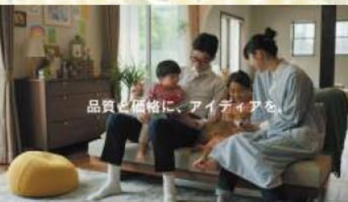
品質と価格に、アイデアを。