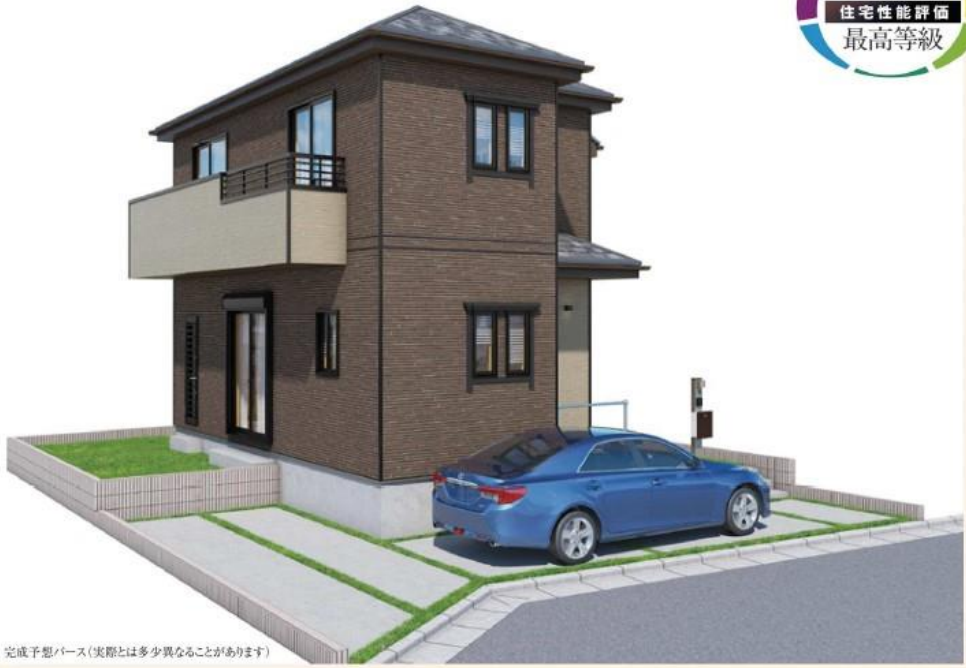
完成予想パース(実際とは多少異なることがあります)