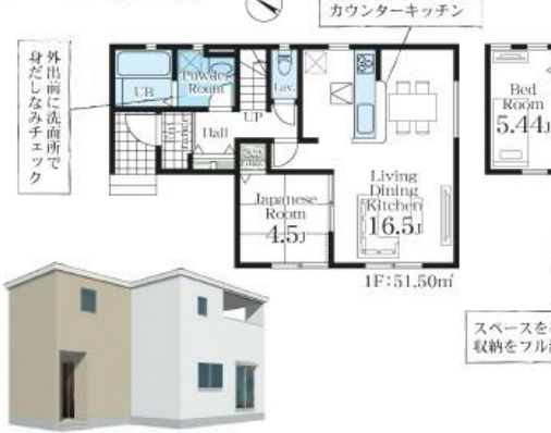
※完成予想図/このパースは図面を基に描いたもので実際とは多少異なる場合がございます。

2号棟 ■土地面積:156.61㎡ ■建物面積:105.32㎡ ■建築確認番号:第23UD11W建07711号(令和6年3月25日) 4LDK