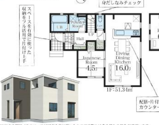
※完成予想図/このパースは図面を基に描いたもので実際とは多少異なる場合がございます。

1号棟 ■土地面積:155.74㎡ ■建物面積:105.16㎡ ■建築確認番号:第23UD11W建07710号(令和6年3月25日) 4LDK