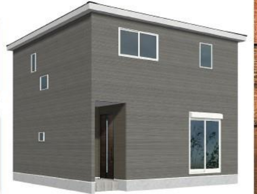
※完成予想図/このパースは図面を基に描いたもので実際とは多少異なる場合がございます。