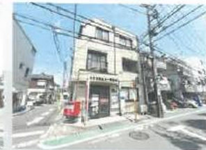
世田谷桜上水一郵便局