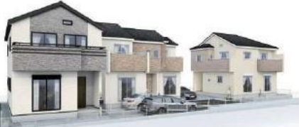
イメージパース※このイラストは図面に基に描きおこしたもので実際とは多少異なります。

駅まで徒歩圏内・バス利用で2路線利用可!都心への好アクセス・利便性にすぐれた立地! 住宅性能評価W取得と税制優遇の長期優良住宅・BELS最高等級の5つ星認定!耐震等級3(最高級)・断熱等性能等級5の永住邸!