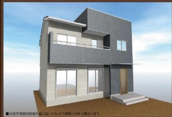
■完成予想図は概略図を基に描いたもので実際とは多少異なります。