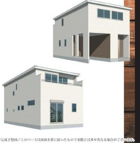
※完成予想図/このパースは図面を基に描いたもので実際とは多少異なる場合がございます。

物件番号 2490-39FB | 情報公開日 2024年09月09日 | 広告有効期限 2024年09月24日 | 仲介手数料無料+期間限定キャンペーン実施中!