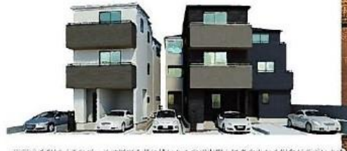
※写真はイメージ。このイメージは関係者に基づいたもので実際とは多少異なる場合があります。

物件番号 FB31-495B | 情報公開日 2024年09月09日 | 広告有効期限 2024年09月24日 | 仲介手数料無料+期間限定キャンペーン実施中!