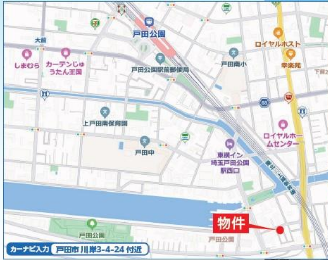
カーナビ入力 | 戸田市川岸3-4-24 付近