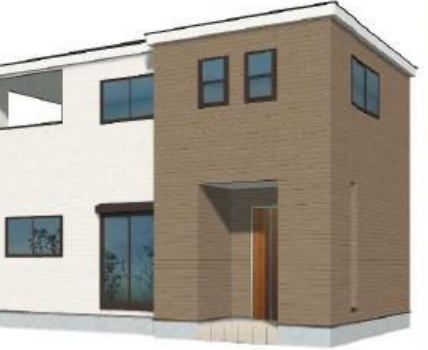
※完成予想図/このパースは図面を基に描いたもので実際とは多少異なる場合がございます。